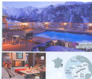
Location d'été à l'hôtel Alta Peyra

Haut perché Pour accéder à l'hôtel Alta Peyra, à Saint-Vincent, vous ne serez pas bloqué par la neige ou le verglas: la route est chauffée. Cela donne une idée du standing: un 4-étages composé de cinq maisons à l'architecture traditionnelle. Si la décoration contemporaine peut détonner, les prestations sont de qualité: trois restaurants sont proposés. A partir de 220 € et la nuit en demi-pension: 04.92.22.24.00, www.hotelaltapeyras.com